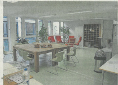
Blick ins neue Lehrerzimmer.