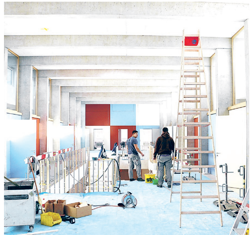
Handwerker im Einsatz im Obergeschoss des Schulhauses.