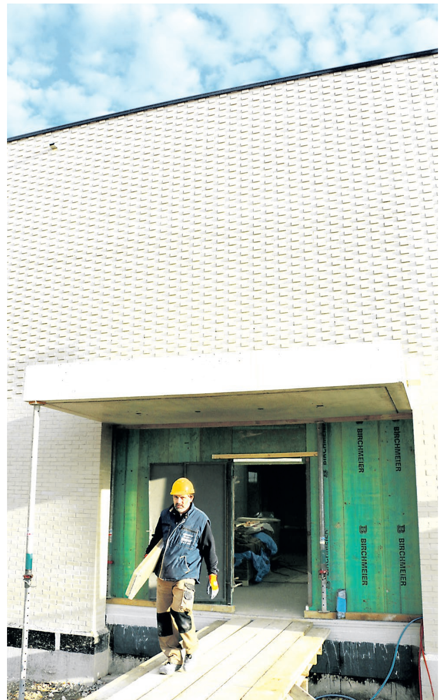
Markante Klinkersteine rund um den Haupteingang der Sporthalle.