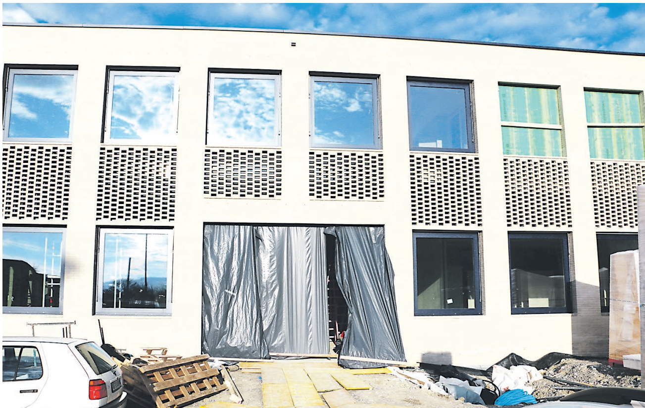
Noch ist der Haupteingang des Schulhauses mit Plastik vermachet.